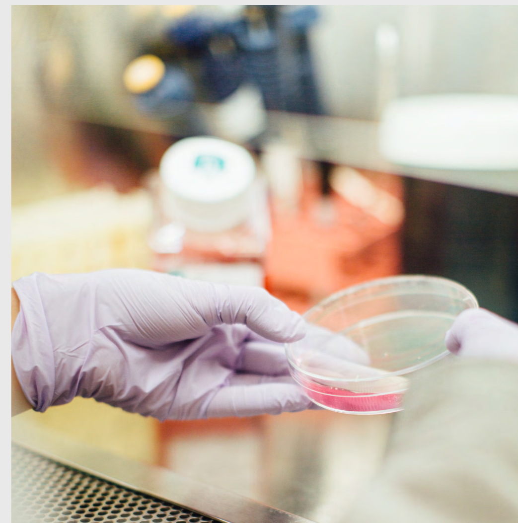
InnoExplorer-projekterne vil være centreret omkring forskerteams med forskningsresultater, der har kommercielt potentiale.

Som følge af nedlæggelsen af Markedsmodningsfonden justeres InnoBooster for at sikre tydelighed omkring muligheden for at få medfinansieret markedsmodningsaktiviteter. Ydermere åbnes innovationsbegrebet også i denne ordning.